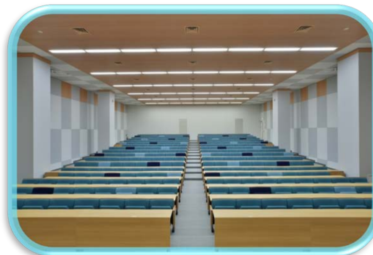
日医工オーデトリウム