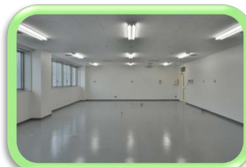
実験室・競争的研究スペース