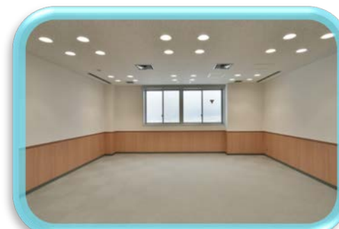
ファカルティルーム