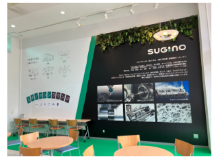
▲スギノマシンラウンジ スギノマシンが施設命名権を取得した富山大学五福キャンパス学生会館ラウンジの愛称です。

イベント第一段として、「つながるcafe@スギノマシンラウンジ」を実施します。今後も参加者の声を反映しながら継続的に実施予定です。