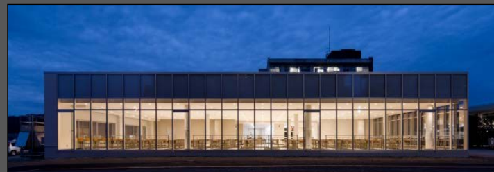
完成写真（外観）：夜景