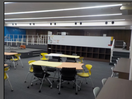
完成写真（室内内観）