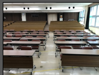
着工前写真（室内内観）