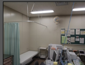
着工前写真（処置室）