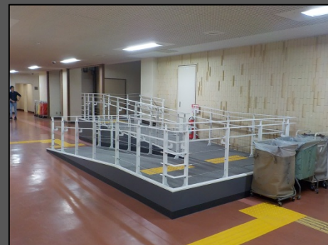
完成写真（ホール内観）