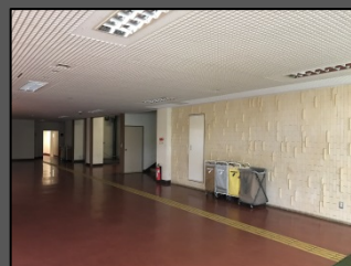
着工前写真（ホール内観）