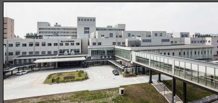
完成写真（全体外観）