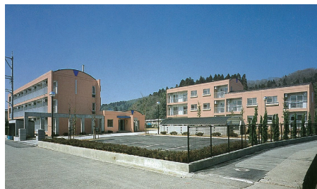
五福国際交流会館