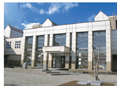
芸術文化図書館 (高岡キャンパス)