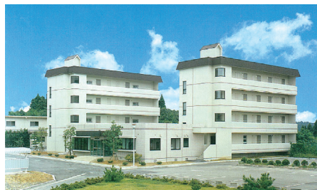
杉谷国際交流会館