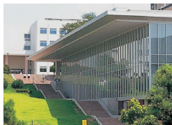
医学学図書館 (杉谷キャンパス)