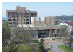
中央図書館 (五福キャンパス)

附属図書館には、様々な分野の学術情報や、学習形態に対応した学習スペースがあります。また、資料を適切かつ効率的に利用する方法を学ぶ、情報リテラシー教育も行っていきます。図書館を大いに活用して、学生生活を充実させましょう。