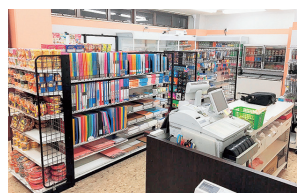
高岡キャンパス購買