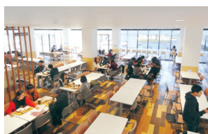
五福キャンパス食堂