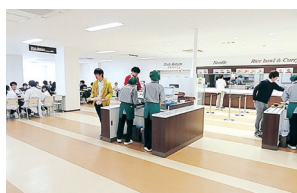
杉谷キャンパス食堂