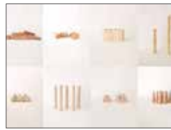
Scenery Block-風景のある積み木- / 木 / 瀬美奈