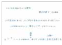
COVID-19流行下における人々の風景に対する感性の変化と新たな価値観 (論文) / 保科さくら