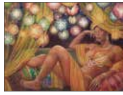
艶麗 / 落合杏