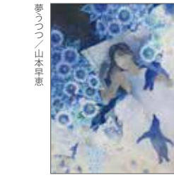
夢うつつ / 山本早恵