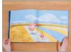
おてんばみいちゃんときいこのしずくくん -絵本における、受け手とコロをつなぐコミュニケーションのための絵本表現の研究「読み聞かせ」に着目して- / 和久田美紅