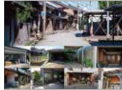
戸建て住宅における駐車空間の使いこなしに関する研究-高岡市吉久の使いこなしの実態と空間・居住者特性との関係に着目して- (論文) / 北島陽貴