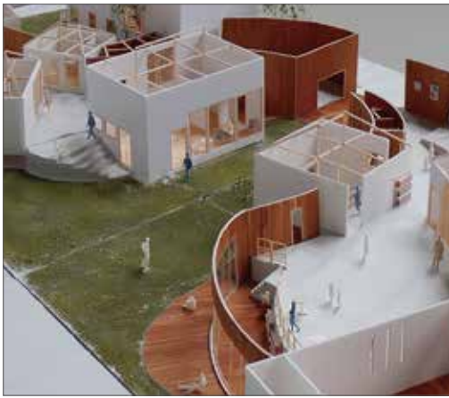
視覚的交流で共生を育む地域福祉施設 / 梶田美結