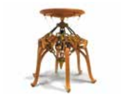
Linkage stool / 菊地莉子