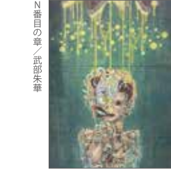
N首の章 / 武部朱華