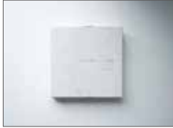
きつと透明、という感触 / 佐藤菜奈