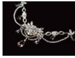
憧れ / 牧谷舞弓