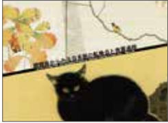
朦朧体からみる日本画の転換点と発展過程 (論文) / 西田奈央