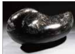
怒涛 / 松原奈美