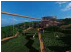
Zooasis-都市のオアシスとしての動物園 / 原田翼也