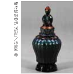
乾漆線画音片透彫 / 柿原千尋