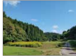
富山県氷見市のホカスギ林業景観の文化的価値 (論文) / 池田俊寛