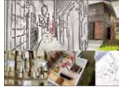
“縁”小路 -輪島市における子どもたちの居場所のための仕掛け- / 林原穂波