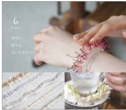
biorry-共に生きるひととき / 吉田海瑠