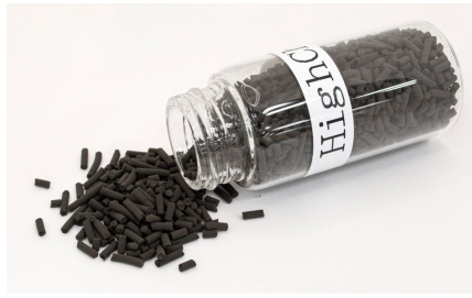
図2：ハイケム工業触媒