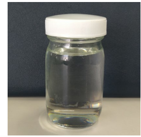
図3：初単離されたCO 2 由来パラキシレン

CO 2 由来パラキシレンは、従来のパラキシレンと同様に高純度テレフタル酸(PTA) (※4) を経由して各種樹脂原料として使用することが可能です。CO 2 由来原料から樹脂を製造することは、CO 2 の排出削減ならびに炭素循環が可能という環境面での利点があります。