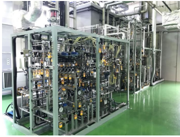
図1：千代田化工建設子安リサーチパーク内パイロットプラント