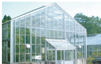
▲ 薬用植物園内の温室

薬学部の長い歴史に付随しており、2023年度には設置100年を迎えるとともに、大規模な施設改修を実施しました。約2,000種の薬用植物を栽培しており、学術研究および学生教育等に広く貢献しています。学内外の共同研究や一般公開も行っています。