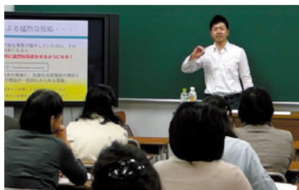
▲ 臨床と発達の心理学講座の様子

教育実践に関する理論的・実践的研究及び指導を行っています。教師教育、教育相談、教材教具の開発、教員の資質を高める講演会の実施、研究紀要の発刊を行っています。